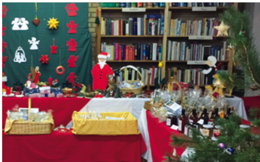
Text und Bild: Anke Grot

Auch für das leibliche Wohl wird für die Dauer des Adventsmarktes im Kirchen-Café gesorgt werden.