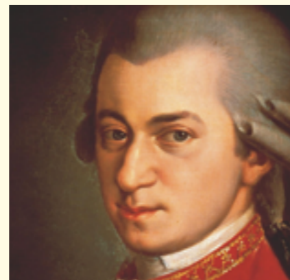
Wolfgang Amadeus Mozart (1756-1791)