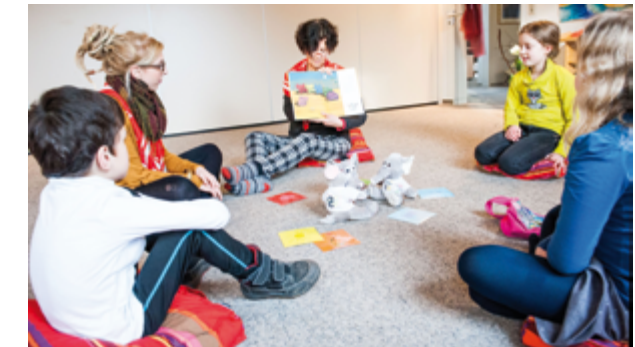
Kindertrauergruppe Café Achterbahn

Die Malteser bitten um Anmeldung unter ☎ 603 30 01.