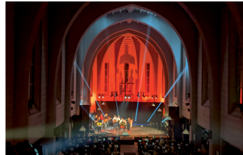
Impression vom Konzert 2019

Musikalisch erwartet die Zuschauer*innen und Zuhörer*innen ein bunter Mix aus Ensembles und Einzelkünstler*innen. Sie bringen Musik aus unterschiedlichen Stilrichtungen zu Gehör. Wortbeiträge bieten einen Einstieg ins Thema und wollen uns zum Nachdenken anregen. Mit dem Konzert soll Geld für die Flüchtlingshilfe gesammelt werden. Man kann durch Überweisung auf das Konto der Evangelisch-Lutherischen Kirchengemeinde Volksdorf oder per PayPal® spenden. Wer eine Spendenquittung benötigt, sollte bitte unbedingt die Überweisungsoption wählen. Bitte unbedingt als Verwendungszweck „Spende Benefizkonzert 2020“ angeben.